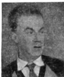
СОБОЛЕВ СЕРГЕЙ ЛЬВОВИЧ (р. 1908). Академик, доктор физико-математических наук. Директор Института математики Сибирского отделения АН СССР. Работает над проблемами вычислительной математики. Основные труды: «Некоторые применения функционального анализа в математической физике» (1950), «Уравнения математической физики» (3-е изд. 1954).

Последние годы — годы быстрого развития экономической науки. Устранение культа личности Сталина благоприятным образом сказалось на развертывании исследований экономики в СССР. Одно из главных достижений этого периода — развитие не только качественной, но и количественной линии анализа экономических категорий коммунистического способа производства. Благодаря успешному развитию математики экономисты получают ныне аппарат для точного определения количественных соотношений в народном хозяйстве. Внесение методов точного естествознания обогащает современную марксистскую экономическую теорию.