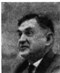
АНТОНОВ ОЛЕГ КОНСТАНТИНОВИЧ (р. 1906). Член-корреспондент АН УССР, доктор технических наук. Генеральный конструктор авиации. Работает над проблемами самолетостроения, организации промышленности, технического творчества, искусства, физической культуры, градостроительства.

Перед нашим «круглым столом» поставлены вопросы, которые интересуют зарубежных читателей: «ведет ли применение кибернетики и математических методов в экономической науке и планировании к «эволюции основ советского строя» и «отказу от центральных пунктов учения Маркса»?