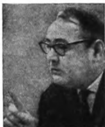
ФЕДОРЕНКО НИКОЛАЙ ПРОКОФЬЕВИЧ (р. 1917). Академик, доктор экономических наук Заместитель академика-секретаря Отделения экономиче- ских наук АН СССР, директор Центрального экономико-математического института АН СССР. Работает над проблемами экономики химической промышленности и экономико-математиче- ских методов. Основные труды: «Экономика химической промышленности» (1958), «Экономика промышленности синтетических материалов» (1961, 1964). Другая часть выступления помещена на стр. 181.

Опыт нас убеждает, что решение любой задачи машинными методами, даже по частному критерию, дает экономически более эффективный результат, чем решение примитивными средствами. Поэтому экономистам необходимо прежде всего сосредоточить внимание на том, чтобы экономически готовить задачи, разрабатывать критерии оптимальности с целью максимального использования возможностей вычислительной техники и математики.