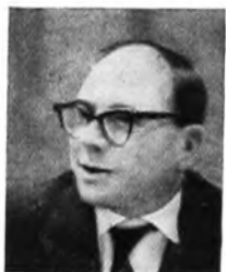
КАНТОРОВИЧ ЛЕОНИД ВИТАЛЬЕВИЧ (р. 1912). Академик, доктор физико-математических наук. Заместитель директора Института математики Сибирского отделения АН СССР. Работает над проблемами математического анализа, вычислительной математики, вычислительной техники и экономико-математических методов. Основные труды: «Приближенные методы высшего анализа» (1936, 1963), «Математические методы организации и планирования производства» (1939), «Экономический расчет наилучшего использования ресурсов» (1959). Другая часть выступления помещена на стр. 161.

В выступлениях В. В. Новожилова и Т. С. Хачатурова не упоминается термин «объективно обусловленные оценки». Тем не менее, они помещены в разделе, который посвящен спору об этих оценках. Почему? Обратите внимание на то место в выступлении Т. С. Хачатурова, где идет речь о модели народного хозяйства, соединившей все многообразие экономических явлений в одном показателе — ценах, которые меняются в зависимости от дефицитности продукции. Эти цены и есть объективно обусловленные оценки в понимании Т. С. Хачатурова. Иначе говоря, он отрицает возможность практического применения о. о. оценок. Другой экономический смысл о. о. оценок видит В. В. Новожилов. Он считает, что эти оценки представляют собой особые множители, которые являются математическим основанием полного согласования локальных и народнохозяйственных затрат и результатов производства. Очевидно, в этом случае о. о. оценки оказываются весьма важным инструментом для практического управления экономикой.