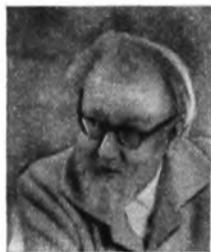
СТРУМИЛИН СТАНИСЛАВ ГУСТАВОВИЧ (р. 1877). Академик. Работает над проблемами экономической теории, статистики и истории народного хозяйства. Основные труды: «Богатство и труд» (1906), «Проблемы экономики труда» (1925), «Очерки советской экономики» (1928), «Промышленный переворот в России» (1944), «История черной металлургии в СССР», т. I (1954), «На плановом фронте» (1958), «Статистико-экономические очерки» (1958), «На путях построения коммунизма» (1959), «Проблемы социализма и коммунизма в СССР» (1961).

Система «человек — машина» весьма важна для разработки проблем оптимального планирования и управления народным хозяйством. При оптимальном планировании инициатива и творчество человека, подкрепленные мощной вычислительной техникой, будут играть решающую роль. И хотя абсолютного оптимума не может быть получено, система руководства хозяйством будет постоянно совершенствоваться, все больше и больше приближаясь к нему.